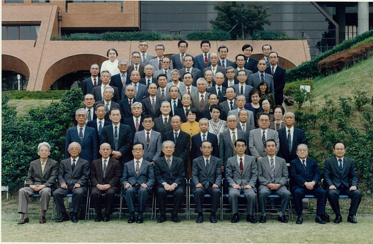
大阪大学 千石会 総会 平成元.10.28